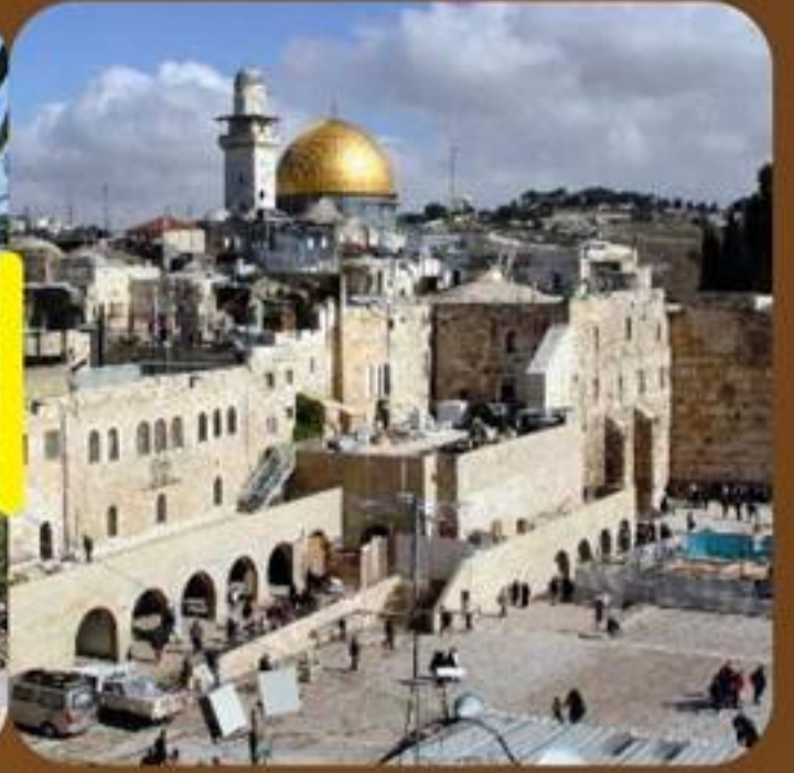
Old City Jerusalem