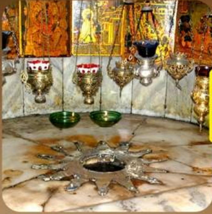
Church Of Bethlehem